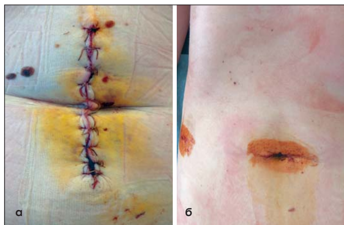
Рис. 1. Вид послеоперационных ран: а – после срединной лапаротомии у пациента с экстренной хирургической патологией; б – после малотравматической лапароскопической операции (однопортовая лапароскопическая холецистэктомия) у пациентки

В настоящее время четкого разделения терминов «рубец» и «рубцовая ткань» нет [1]. По своей сути рубец представляет собой соединительнотканное образование, которое формируется в процессе заживления раны, а рубцовая